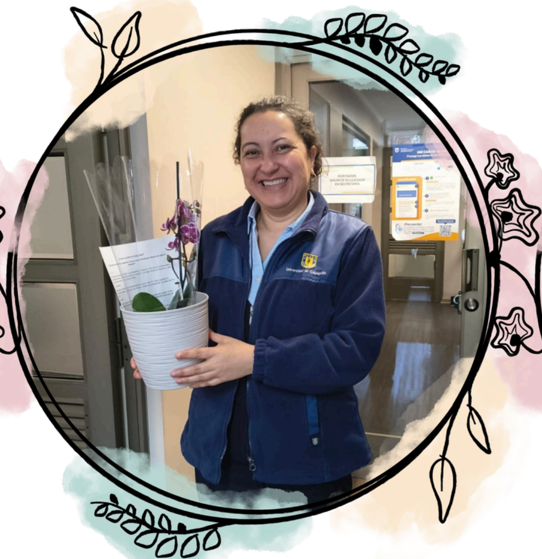
Gesenia Sandoval Riquelme Campus Los Ángeles